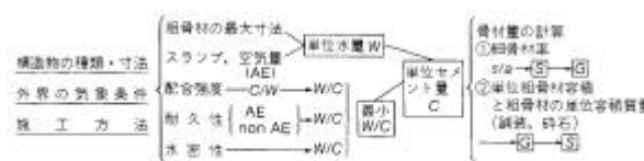
図 5.1 配合設計を進める順序